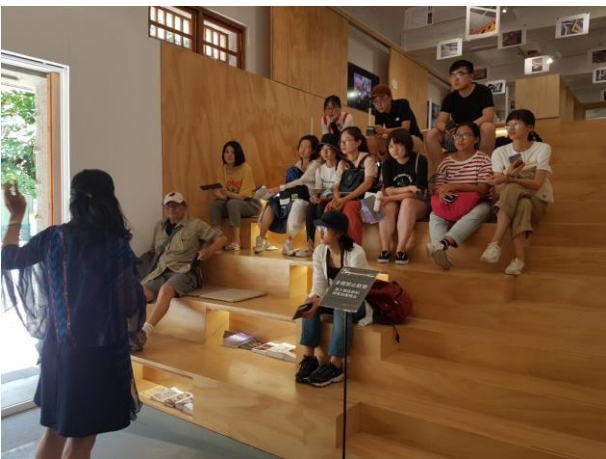
新富町市場的新語彙