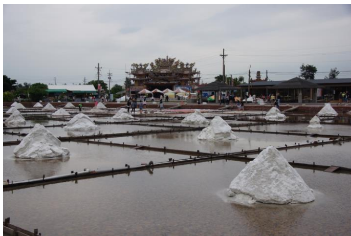
北門瓦盤鹽田歷史與觀光景觀 2