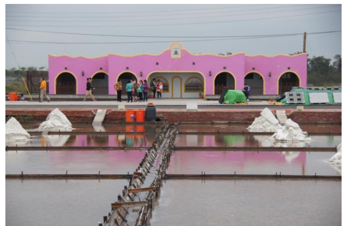
北門瓦盤鹽田歷史與觀光景觀 3