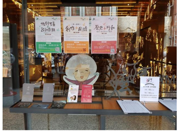
阿嬤咖啡_慰安婦的悲與情 1