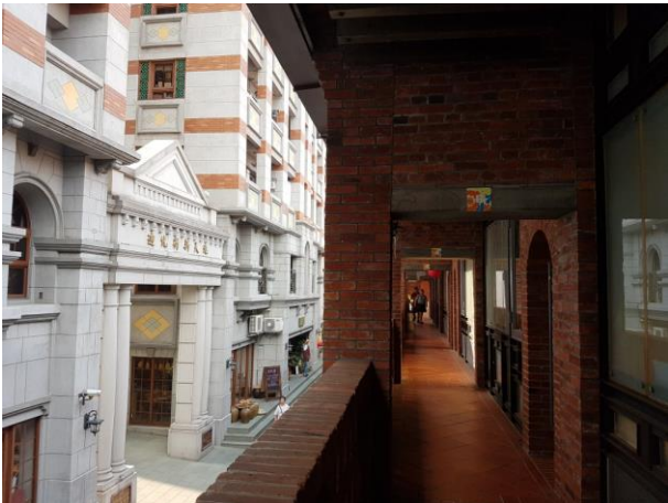
大稻埕_歷史性城市景觀新思維