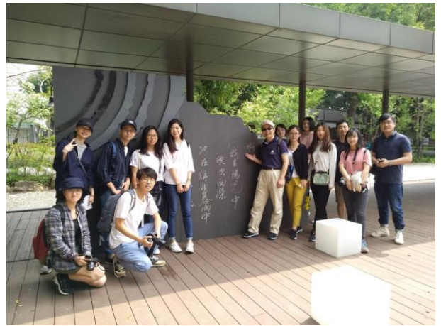
詩意台中文學公園