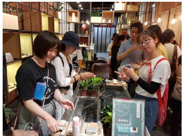
大稻埕(迪化街)新意