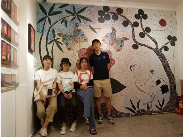
迪化 207 博物館