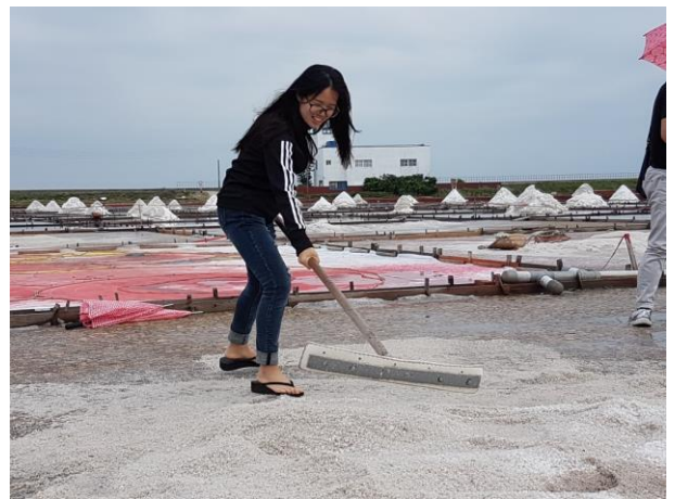
北門瓦盤鹽田歷史與觀光景觀 1