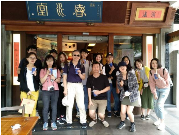
珍奶台中據說是最早的春水堂