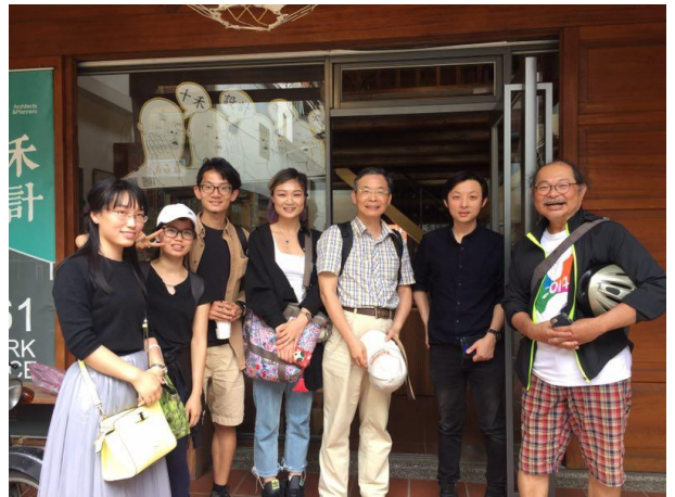
十禾設計在大稻埕的努力