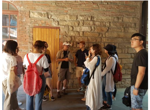
剝皮寮的歷史興衰