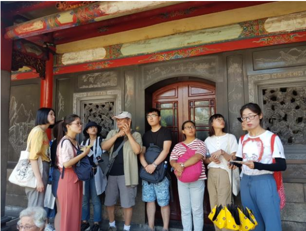
龍山寺_艋舺文化核心