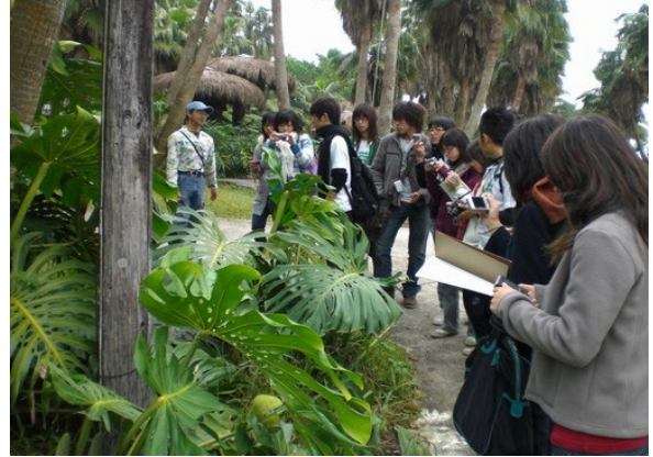
新竹綠世界休閒農場植物解說