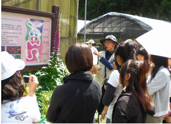
臺大梅峰農場溫帶植物解說