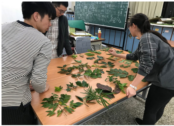
每月1對1植物辨識測驗