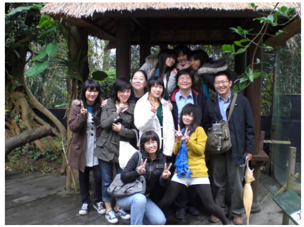
校外教學：新竹北埔綠世界