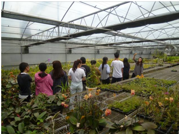
興大附農溫室參訪及栽培解說