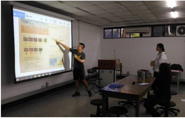
植栽設計階段評圖