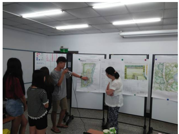
植栽設計階段評圖