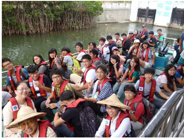
校外教學：台南四草綠色隧道