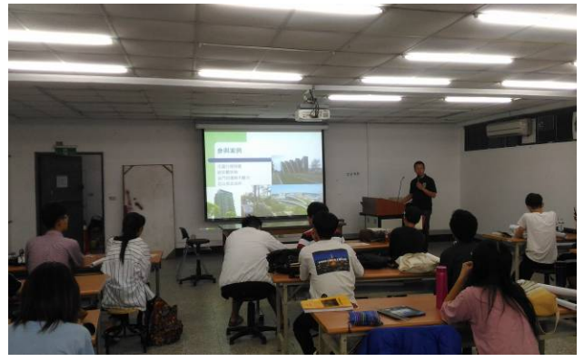
定期邀請校外專家進行專題演講