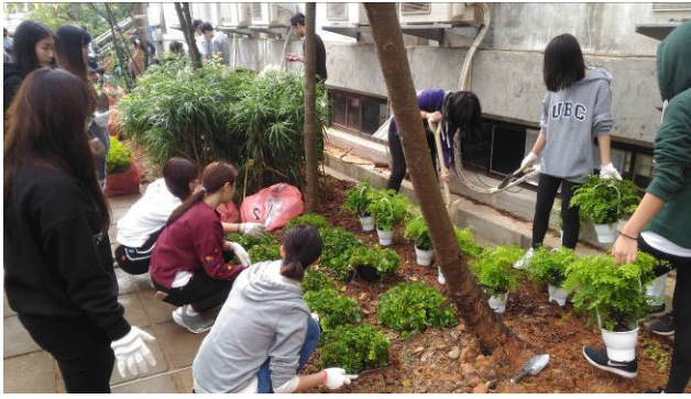
景觀系館植栽設計配置種植實習