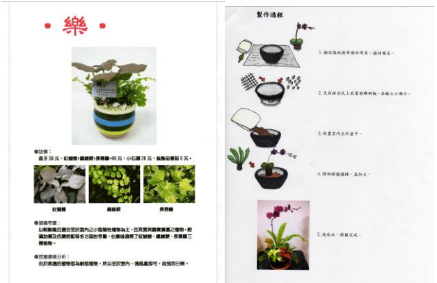
組合盆栽設計說明