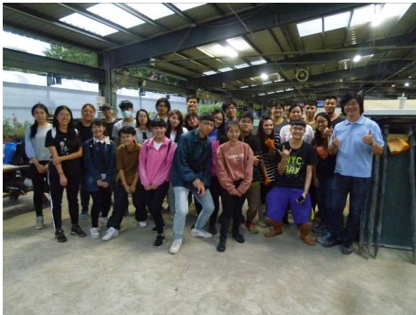
興大附農造園丙級實習場參訪及實作練習