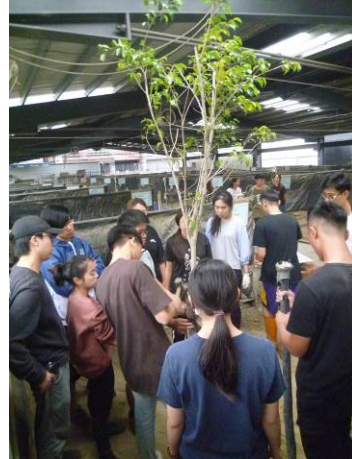
興大附農造園丙級實習場參訪及實作練習