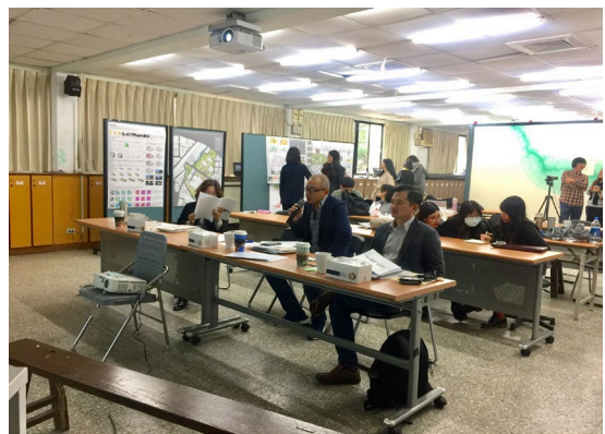
邀請青境景觀工程總經理來評圖