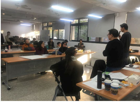
景觀學會許理事長與同學分享評圖感想