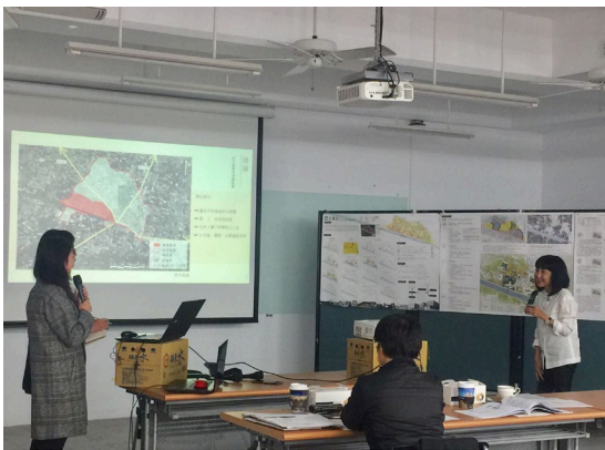
邀請文化景觀系郭主任來評圖