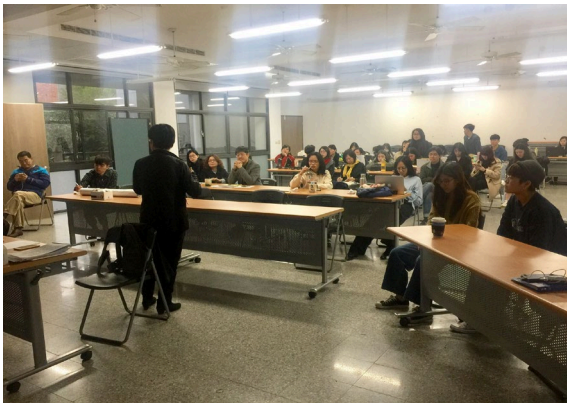
中原景觀鵬主任與同學分享評圖感想